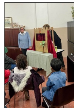
Teatro de marionetas Núria Celeste