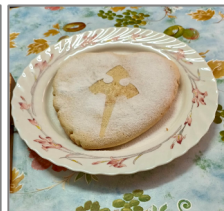
Tarta de Santiago