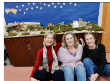
Pesebre Viky Ana Nunú