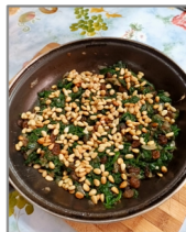
Espinacas a la catalana